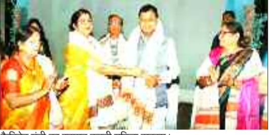
कैबिनेट मंत्री का स्वागत करती महिला सदस्य।

उक्त बातों टीपी नगर स्थित ऑडिटोरियम में आयोजित अखिल भारतीय मारवाड़ी महिला समाज के सप्तम प्रांतीय अधिवेशन के दौरान कार्यक्रम के