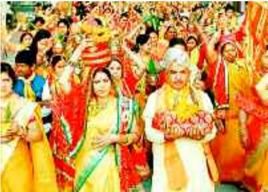
कलश यात्रा निकालते श्रद्धालु।