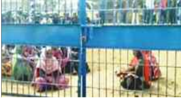
धरने पर बैठे ग्रामीण।