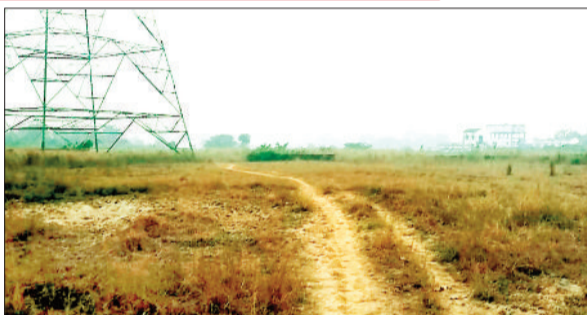
पहुंच मार्ग जिसका नहीं किया गया निर्माण।