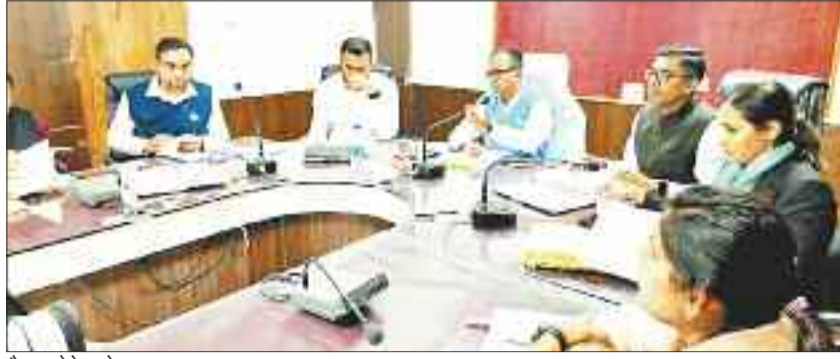
बैठक लेते कलेक्टर।