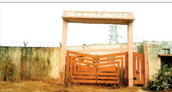
कोहड़िया वार्ड में बनाया गया भवन।